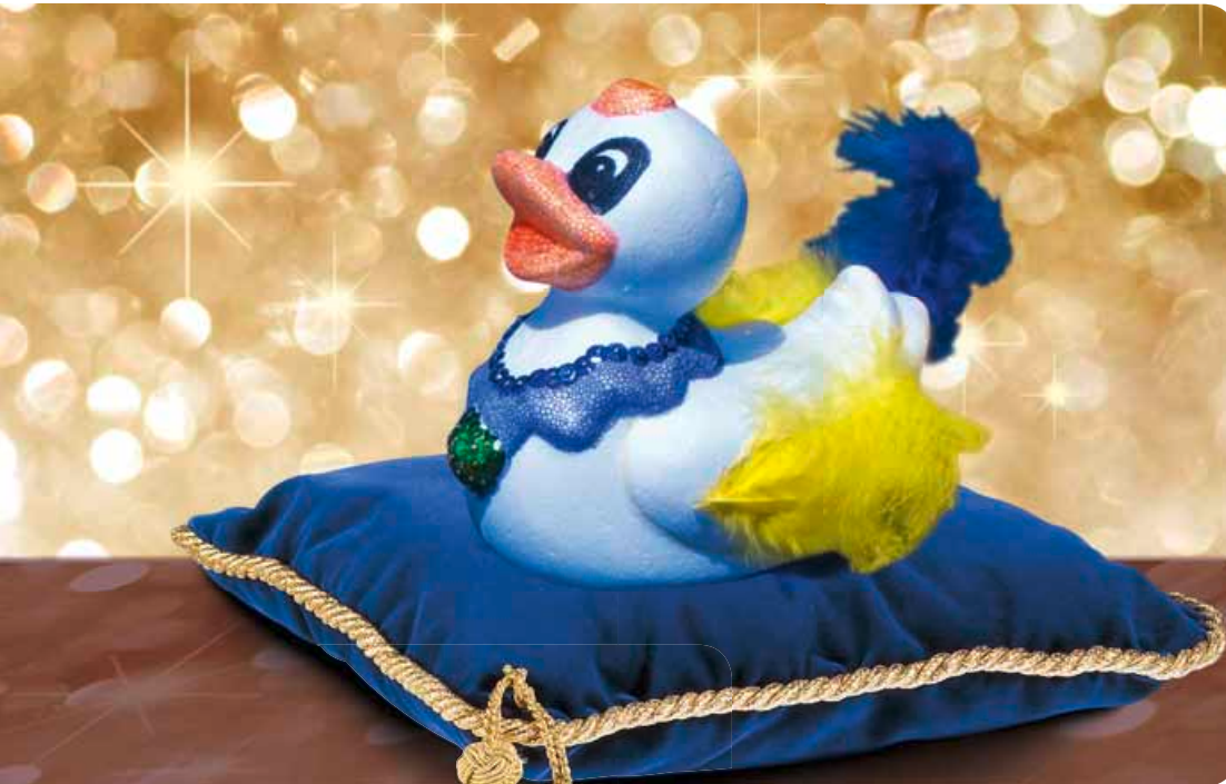
HALLO KIDS, MACHT MIT! Tolle Preise warten auf die am schönsten herausgeputzten Entchen.